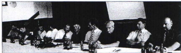
Na novinarski konferenci so o težavah spregovorili predstavniki desetih občin.