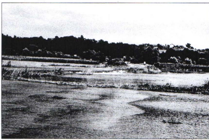
Posledice zadnjega deževja, ki je naše kraje zajelo 4. in 5. avgusta, dokazujejo, da pretočnost reke Pesnice v kritičnih obdobjih ni primerna.

Sicer pa so župani na sestanku, ki so ga imeli v začetku avgusta, sprejeli tudi sklepe, na podlagi katerih zahtevajo, da se prične popis škode na kmetijskih zemljiščih in gozdovih, da se težava oblikuje v pisno poslansko vprašanje, da se ustanovi